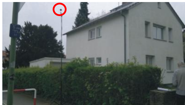
Messung des Baulärms in der Nachbarschaft